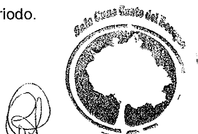
Carolina Cabello Contreras

Se sugiere su contratación para el siguiente periodo.